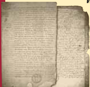
Oorkonde van Exemptie

Wij wensen u een boeiende bezichting toe!